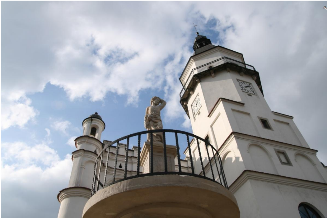
Przed ratuszem stoi marynistyczna kolumna zwana Zośką