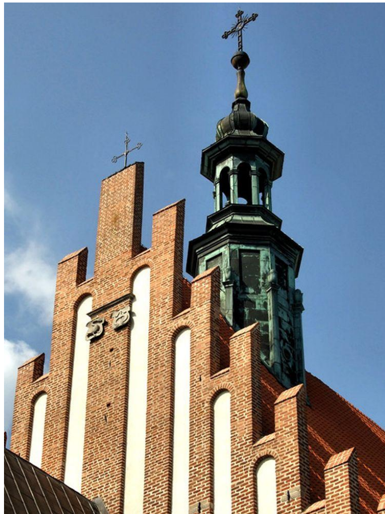
Kościół w Szydłowcu