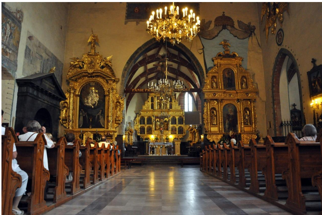
Wnętrze Kościoła farnego z ołtarzem głównym Radziwiłłów.