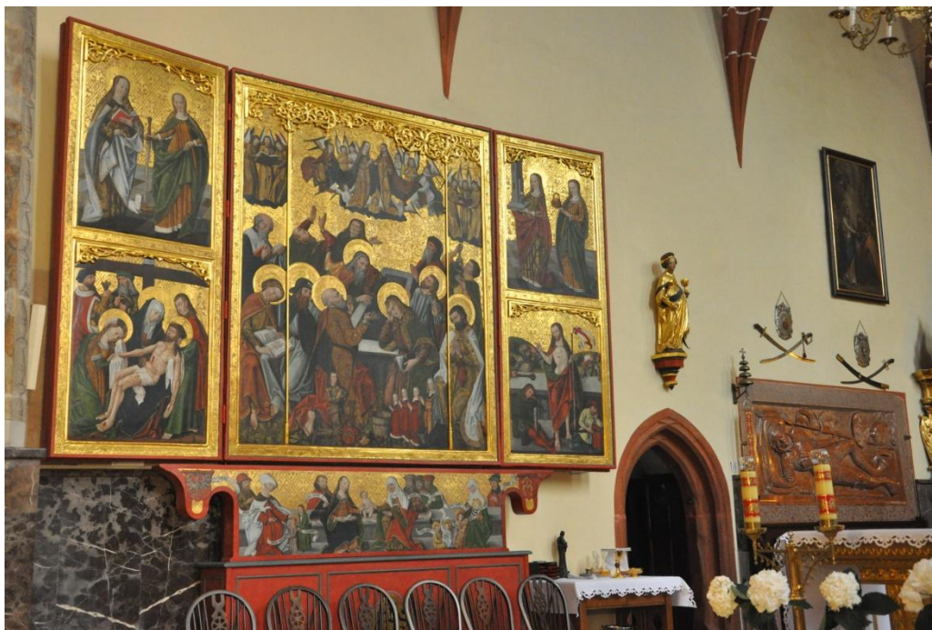
Poliptyk (oltarz) z początku XVI wieku