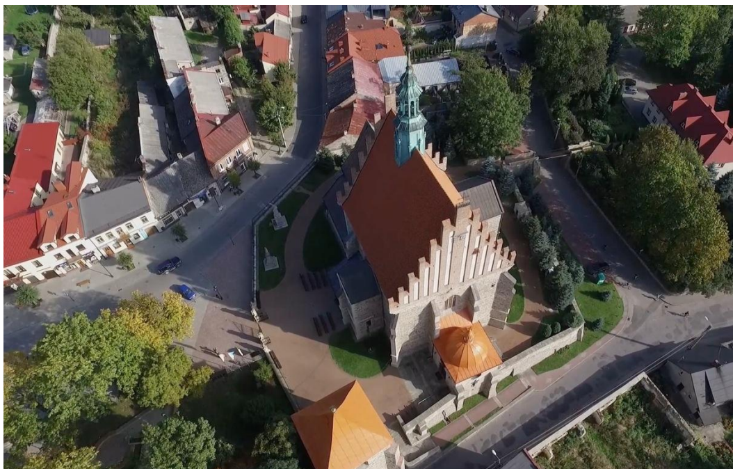
Kościół w Szydłowcu