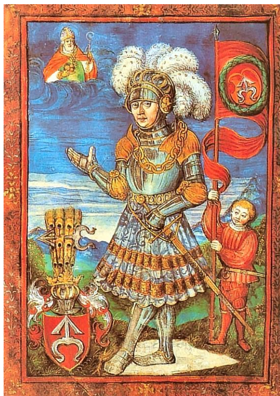
Mikołaj Szydłowiecki – kasztelan radomski i podskarbi wielki koronny (miniatura Stanisława Samostrzelnika)