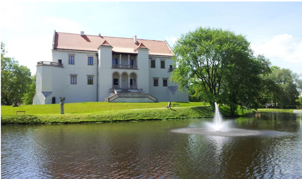
Zamek – elewacja z loggią widokową